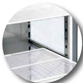
Clayettes en fil d'acier plastifié blanc (en option)