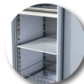
Divers aménagements possibles